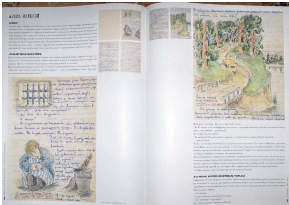
Pagini din gulag-ul Eufrosiniei Kersnovskaia

Acest volum este un omagiu adus autoarei cu ocazia unui centenar din ziua nașterii. Lucrarea s-a învrednicit de premiul Cartea Anului – 2007 din Rusia la capitolul Memoria Trecutului . Istoricul Valeriu Pasat, membru corespondent al Academiei de Științe a Moldovei, prin aceste lucrări, a adus o contribuție importantă la cercetarea istoriei noastre contemporane.